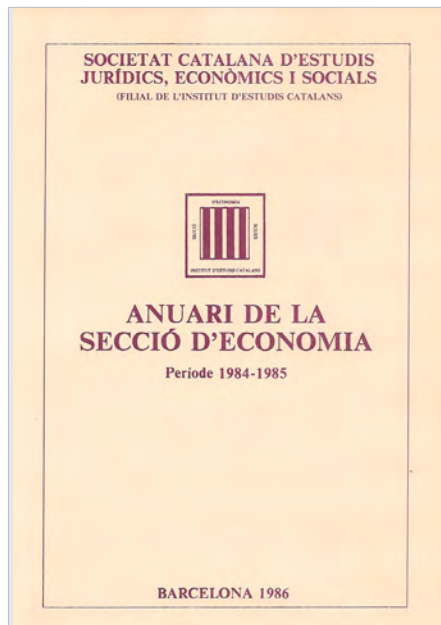
Imatge de la portada de l'Anuari núm. 5.