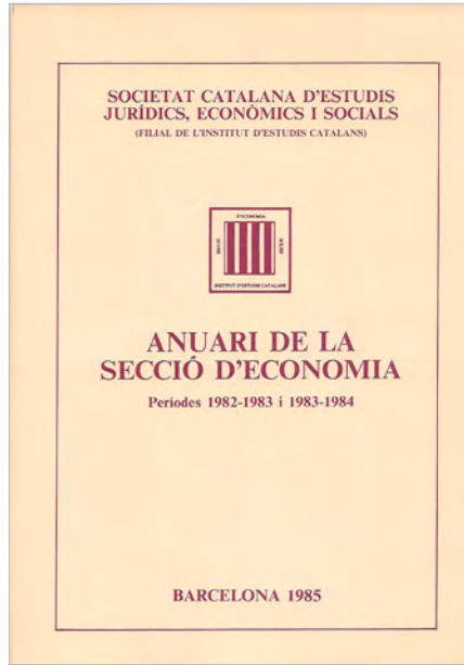
Imatge de la portada de l'Anuari núm. 4.