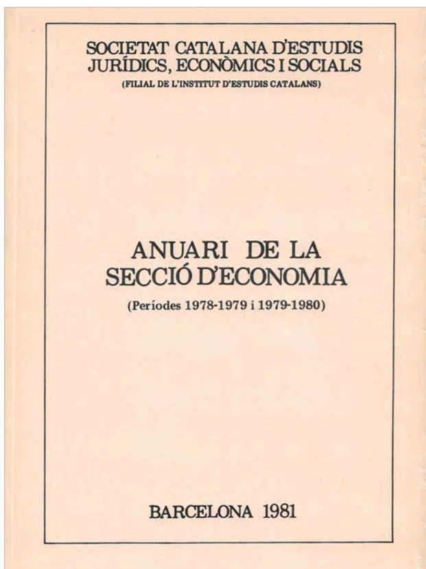
Imatge de la portada de l'Anuari núm. 2.