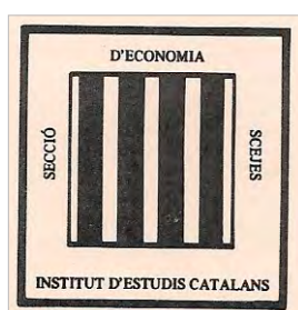
Imatge de l'escut de l'SCEJES – Secció d'Economia.

A les darreries del 1977 fou constituïda una Comissió gestora per a endegar de nou les activitats de la Secció d'Economia de l'SCEJES, d'acord amb les necessitats de l'època i la situació de caràcter acadèmic dels economistes catalans. L'objectiu fou el d'agrupar tots els economistes dels països catalans (o economistes de llengua catalana, en similitud amb l'«Association d'économistes de langue française») que treballen en l'estudi i la recerca de l'economia, en qualsevulla de les branques de la ciència econòmica, encara que amb un especial interès —però no exclusivament— en la temàtica econòmica relativa als països catalans. També pretenia acollir els qui, no treballant-hi, estan interessats a conèixer i seguir els desenvolupaments que es produeixen en aquests camps.